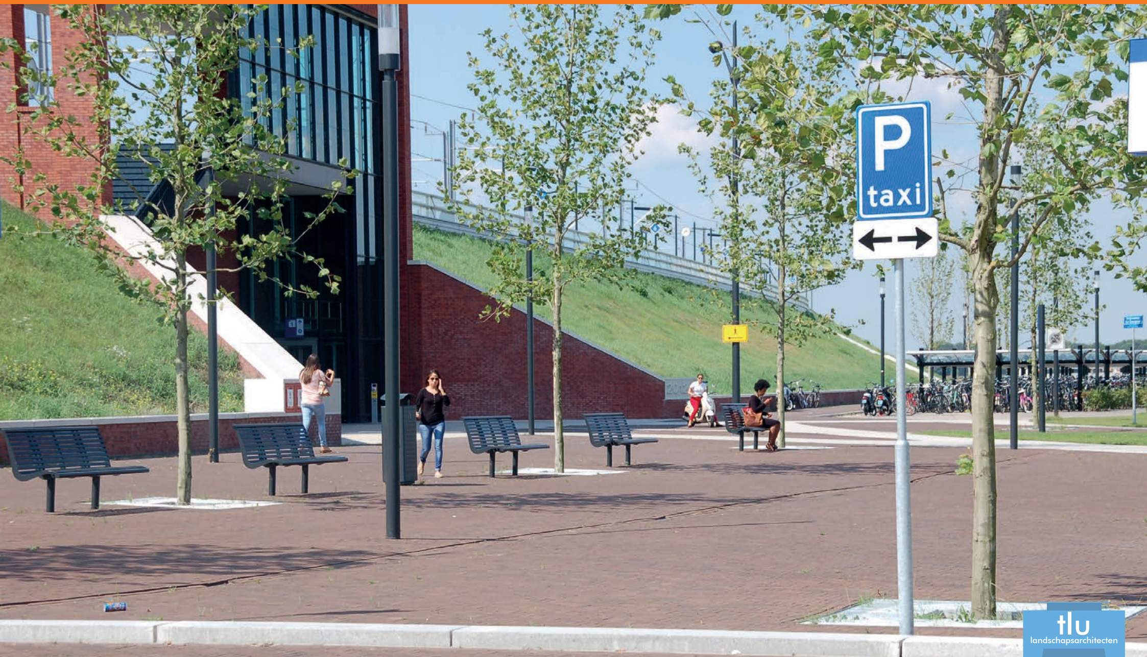
Stationskwartier: stationsplein, P&R en park