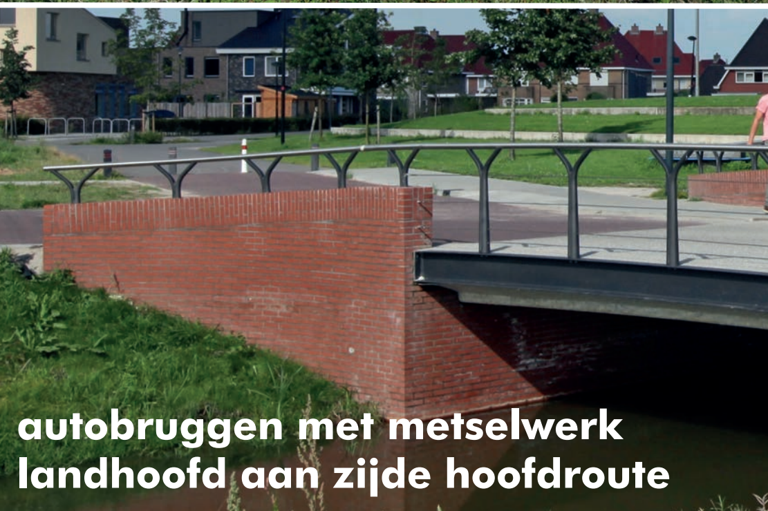
autobruggen met metselwerk landhoofd aan zijde hoofdroute