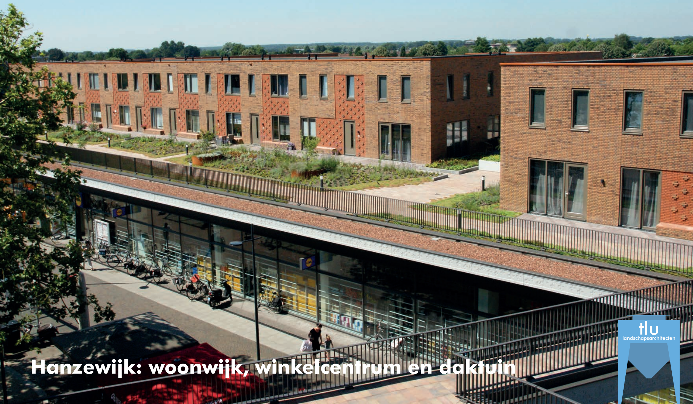
Hanzewijk: woonwijk, winkelcentrum en daktuin