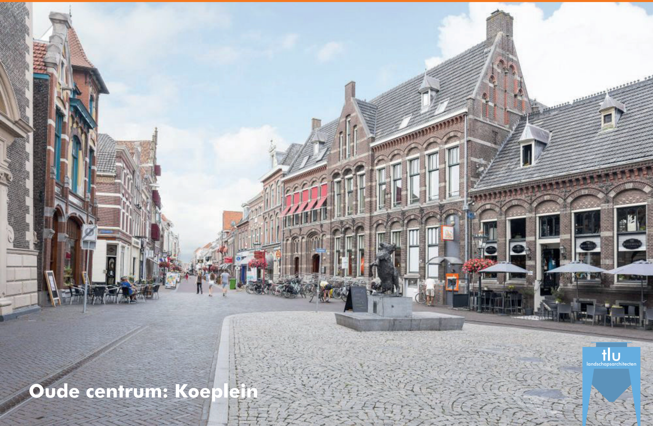
Oude centrum: Koeplein